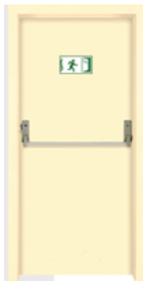
↑ مدل ۳۳۷ S