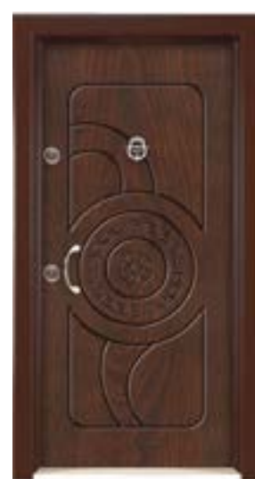
↑ مدل S ۳۳۰