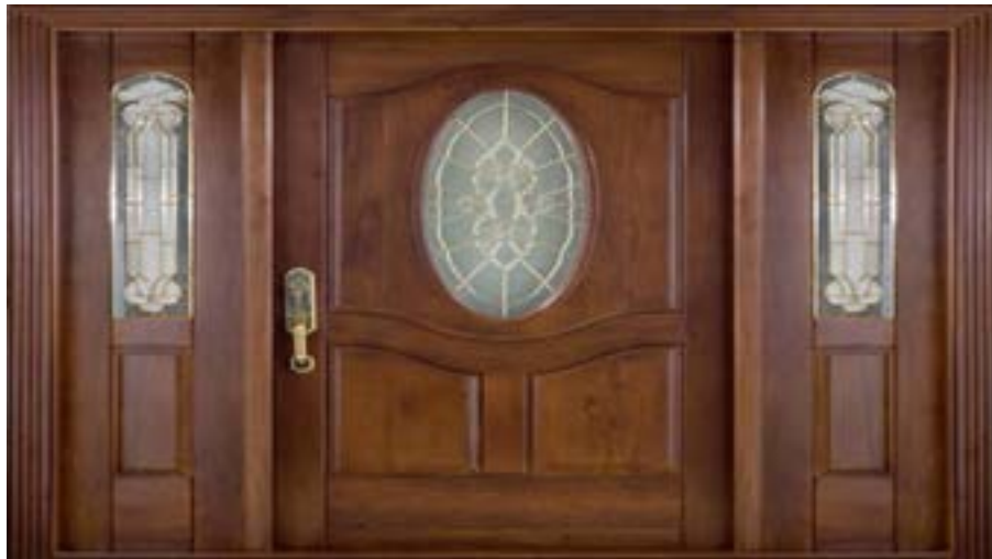
← مدل S ۳۶۱