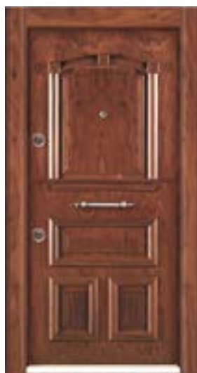
↑ مدل S ۳۰۹