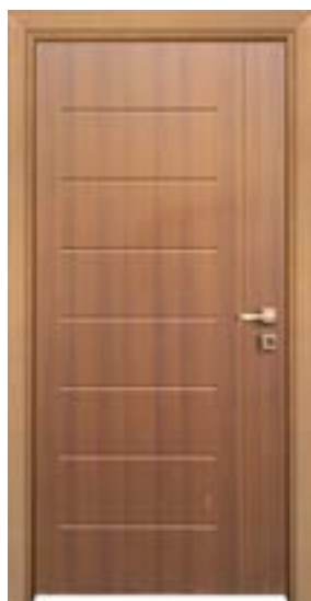
↑ مدل S ۳۴۱