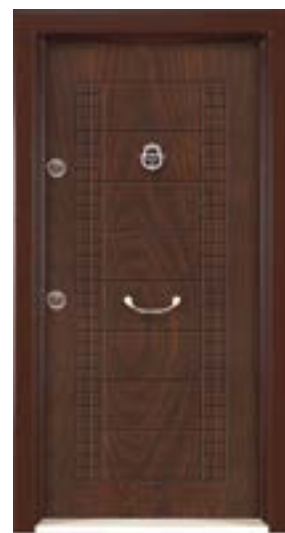
↑ مدل ۳۳۳ S