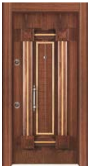
↑ مدل S ۳۰۴