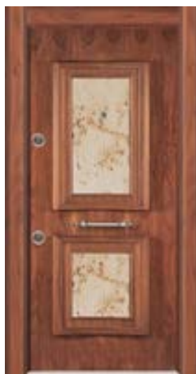
↑ مدل S ۳۰۲