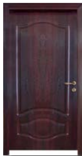
↑ مدل S ۳۵۳