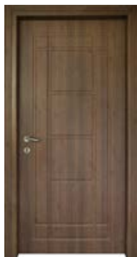
↑ مدل S ۳۴۵