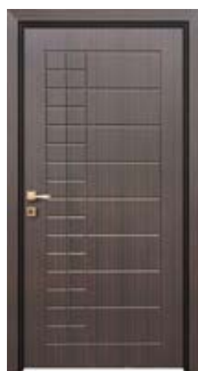
↑ مدل S ۳۴۸