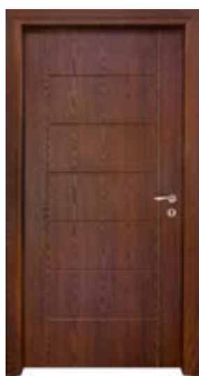
↑ مدل S ۳۵۵