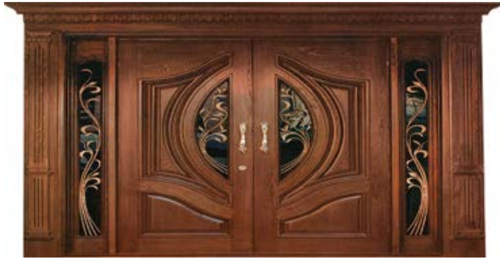
← مدل S ۳۶۰