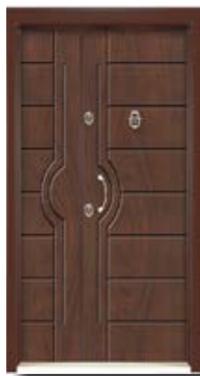
↑ مدل S ۳۳۱