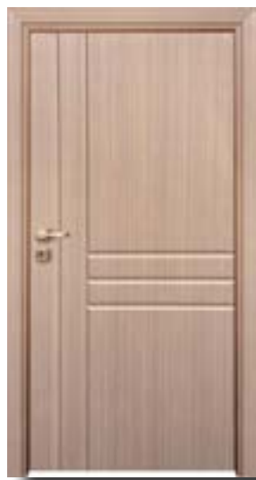
↑ مدل S ۳۴۷