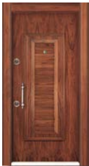
↑ مدل S ۳۰۳