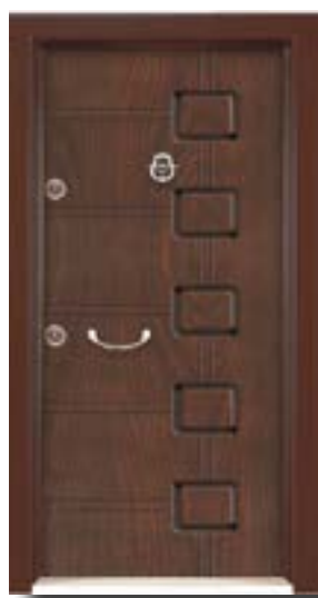
↑ مدل S ۳۲۴