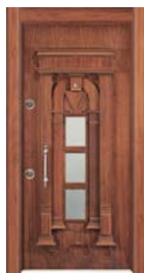
↑ مدل S ۳۰۱