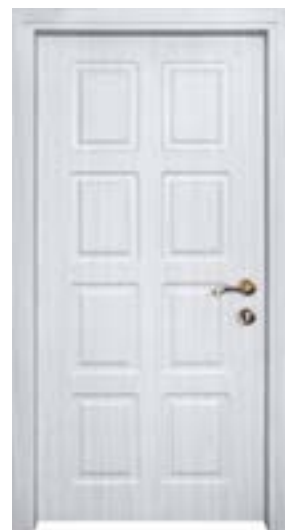
↑ مدل S ۳۴۲