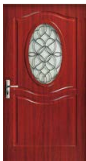
↑ مدل S ۳۵۹