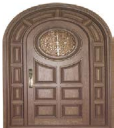
↑ مدل S ۳۶۲