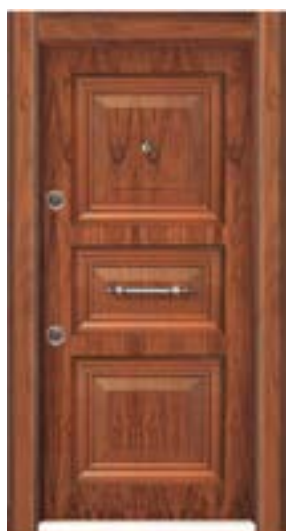
↑ مدل S ۳۱۰