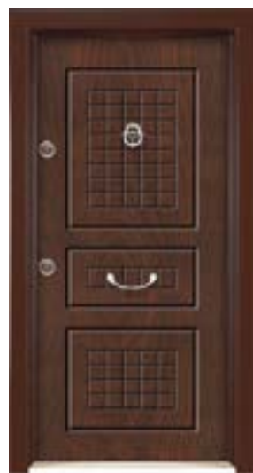
↑ مدل ۳۳۴ S