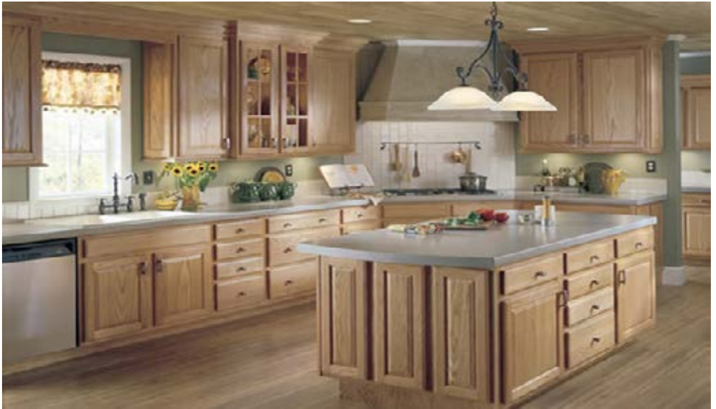
↑ مدل ۳۶۴ S