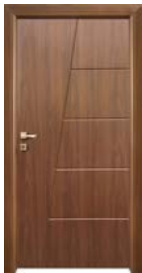
↑ مدل S ۳۴۰