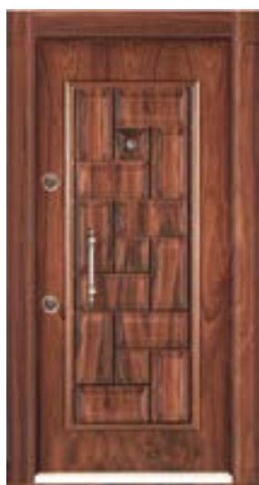
↑ مدل S ۳۰۸