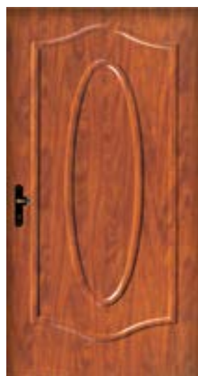
↑ مدل S ۳۵۶