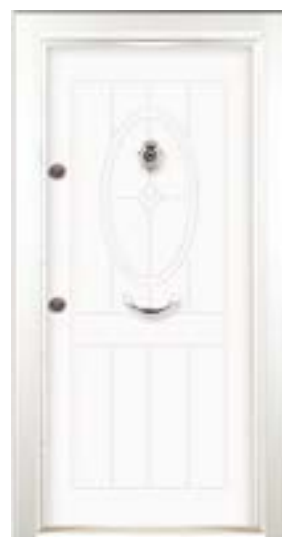
↑ مدل S ۳۲۷