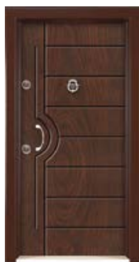
↑ مدل S ۳۳۲