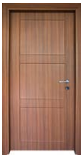
↑ مدل S ۳۵۴