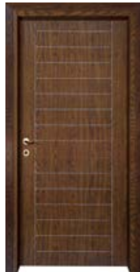
↑ مدل S ۳۳۸