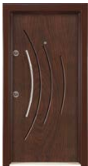
↑ مدل S ۳۲۸