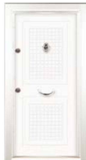
↑ مدل S ۳۲۲