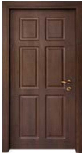
↑ مدل S ۳۴۳