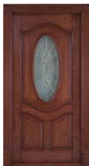
↑ مدل S ۳۵۷