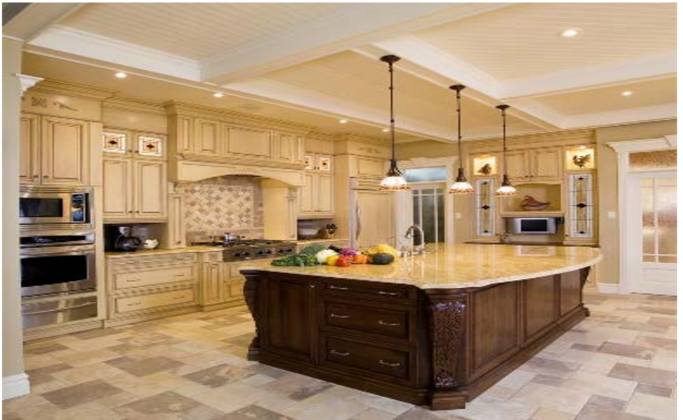
↑ مدل ۳۶۵ S