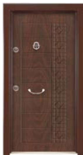
↑ مدل S ۳۲۹