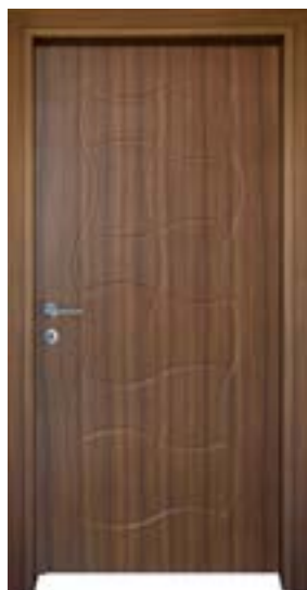
↑ مدل S ۳۵۲