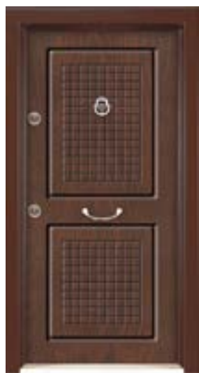
↑ مدل ۳۳۵ S