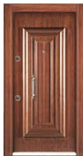
↑ مدل S ۳۰۵