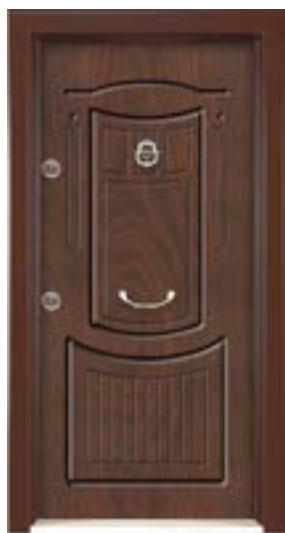
↑ مدل ۳۳۶ S