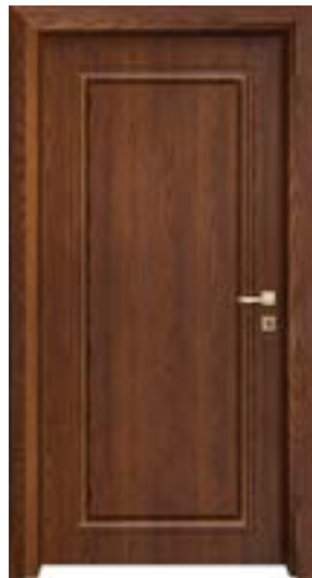
↑ مدل S ۳۴۴