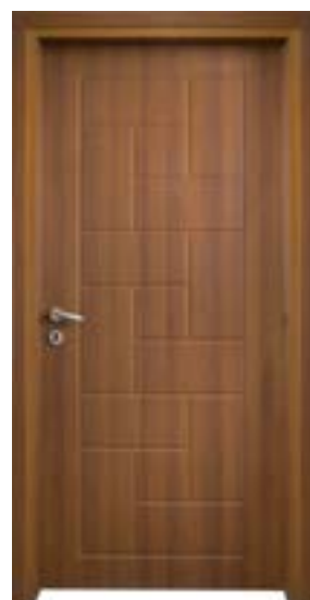
↑ مدل S ۳۴۹