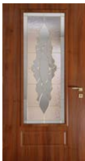
↑ مدل S ۳۵۸