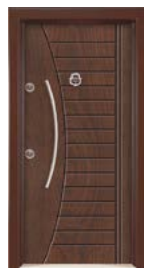
↑ مدل S ۳۲۶