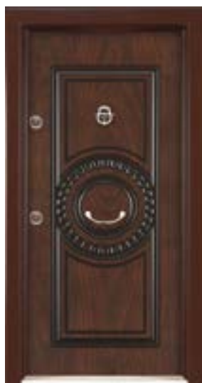
↑ مدل S ۳۲۵