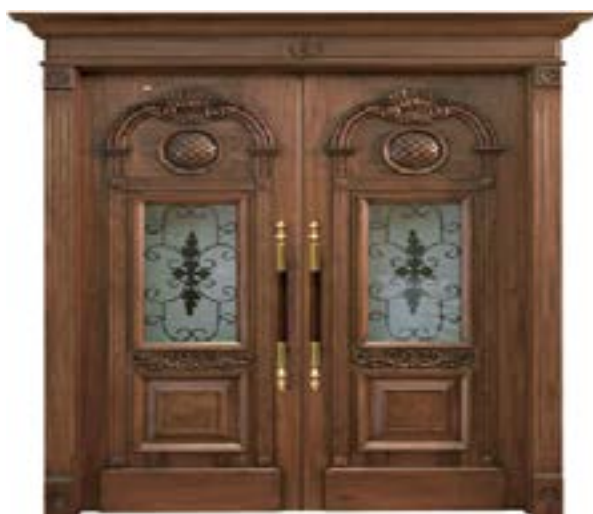
↑ مدل S ۳۶۳