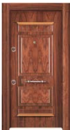
↑ مدل S ۳۰۷