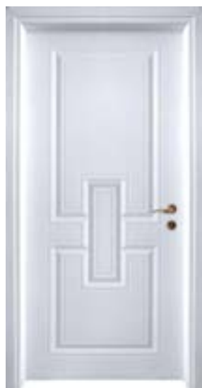
↑ مدل S ۳۳۹