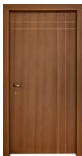
↑ مدل S ۳۴۶