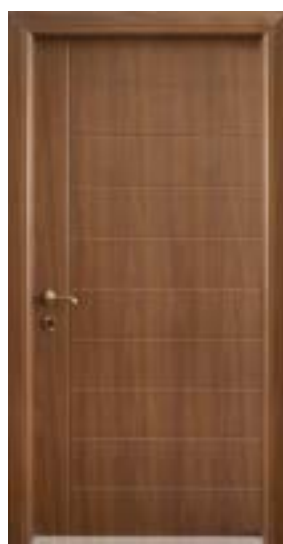
↑ مدل S ۳۵۰