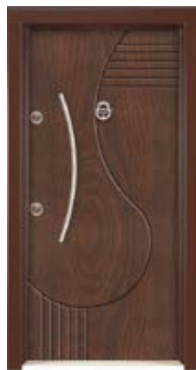
↑ مدل S ۳۲۳