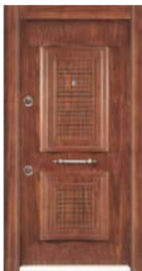
↑ مدل S ۳۰۶