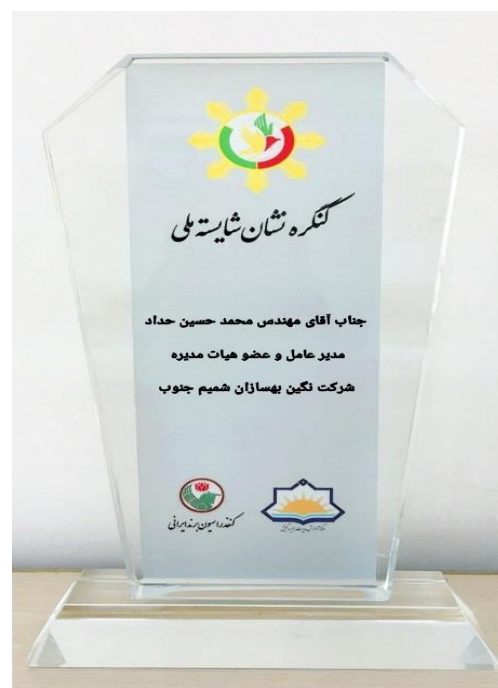
دریافت تندیس نشان شایسته ملی در سال 1397