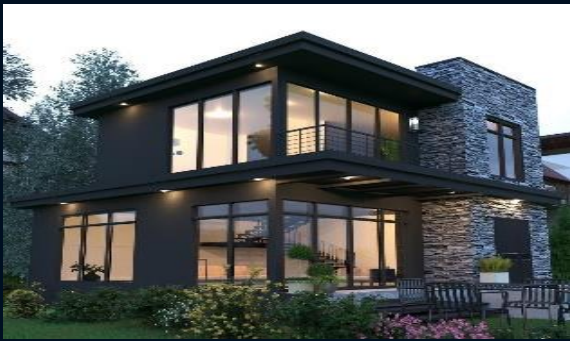
طراحی و معماری