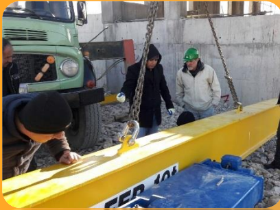
Steel structure of industrial equipment