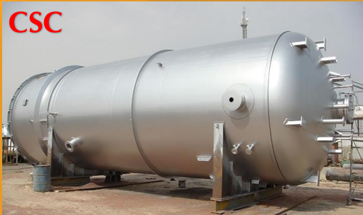
مخازن تحت فشار