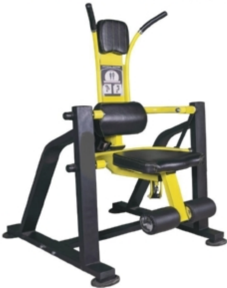
دستگاه شکم و پهلو وزنه آزاد