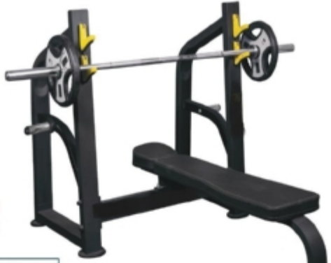
Chest Press میز پرس تخت