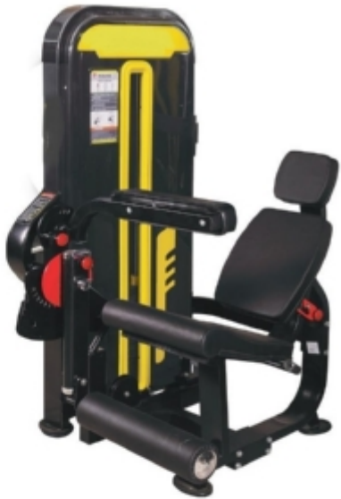
دستگاه پشت پا خوابنده ماشین