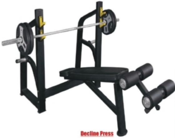
Decline Press میز زیر سینه