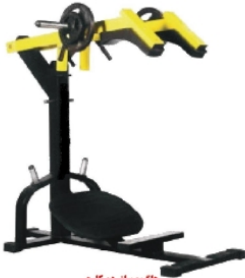
هک و ساق دو کاره