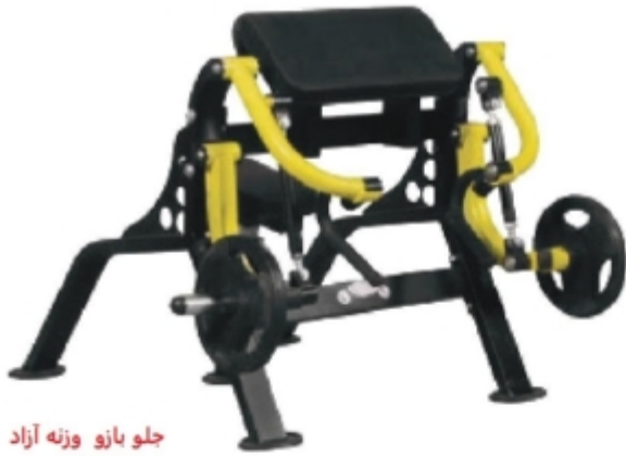
جلو بازو وزنه آزاد