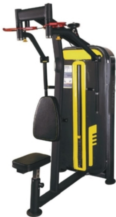
دستگاه قفسه سینه