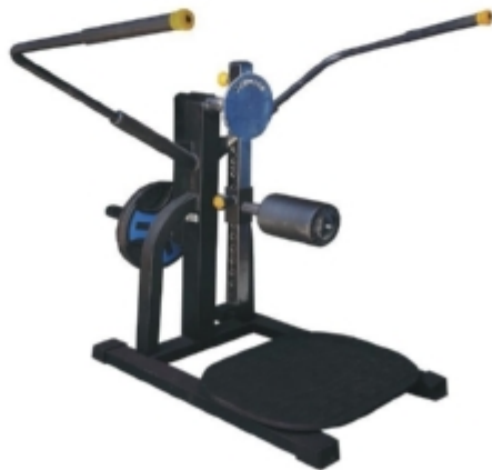
Stand Up hip