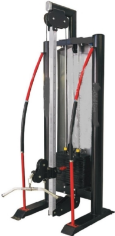
دستگاه کشش دوپل