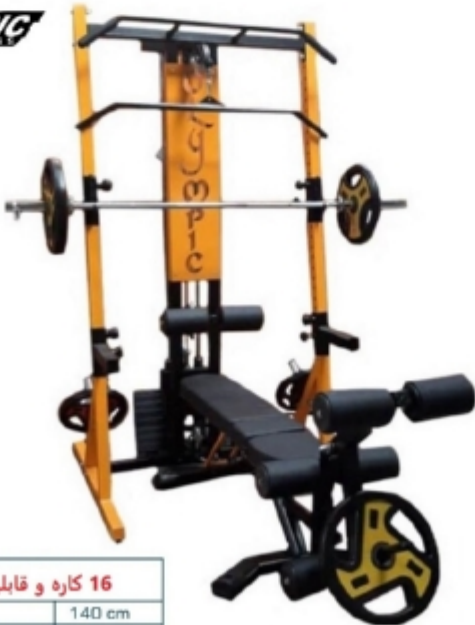
16 کاره و قابلیت ارتقا