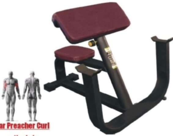
Bar Preacher Curl