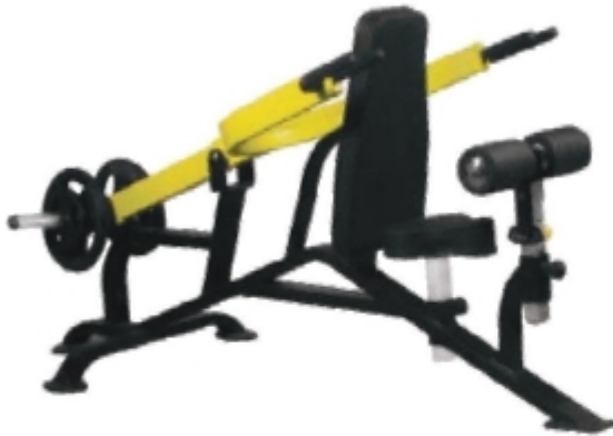
بار اول نشسته (بست بازو دبی)