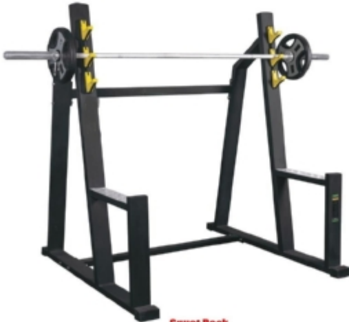
Squat Rack میز اسکات