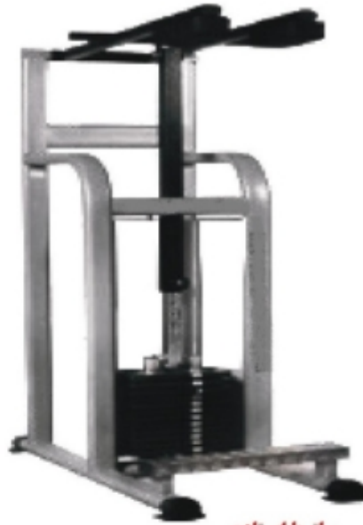
ساق پا ایستاده