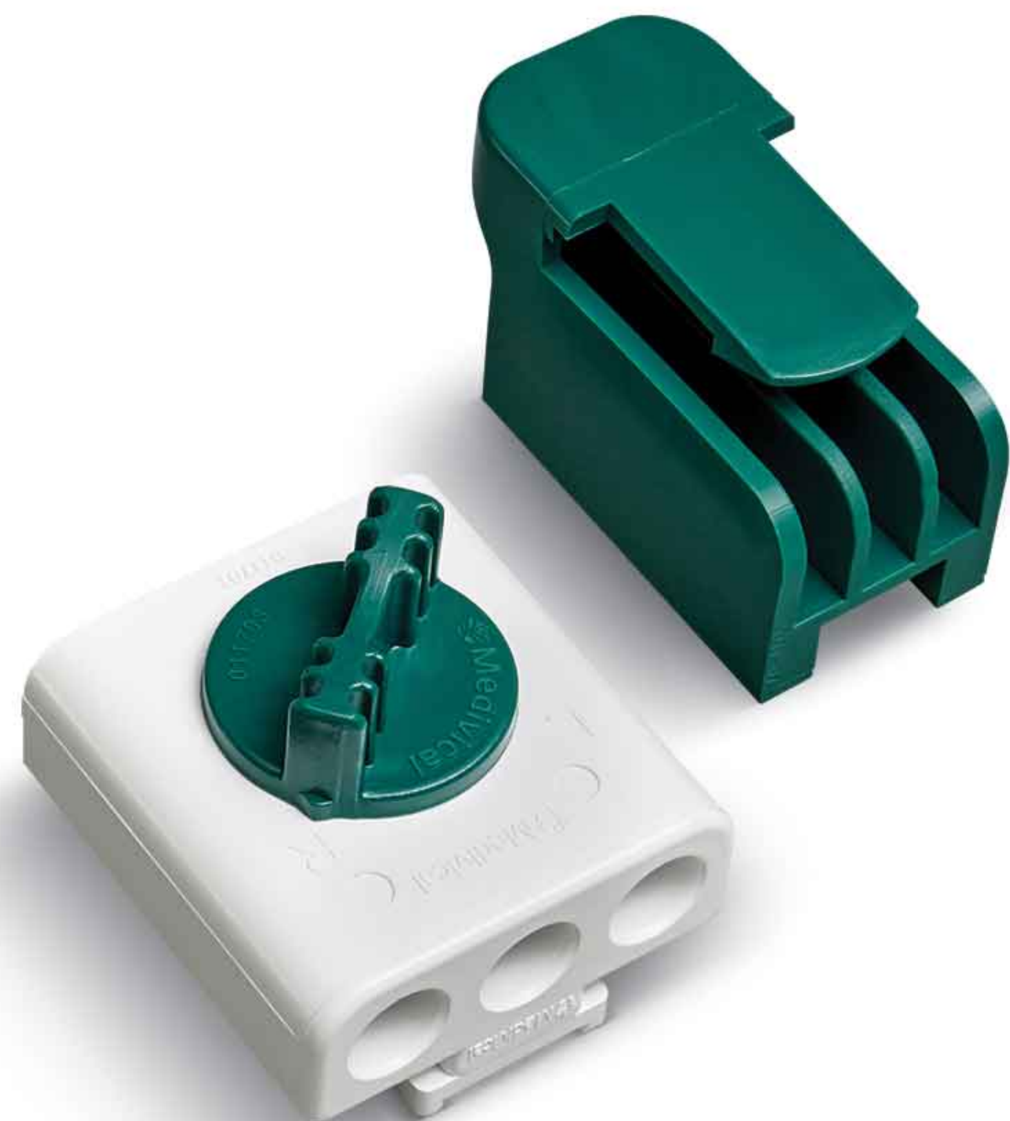
Canister Selection Valve شیر انتخاب محفظه جمع‌آوری