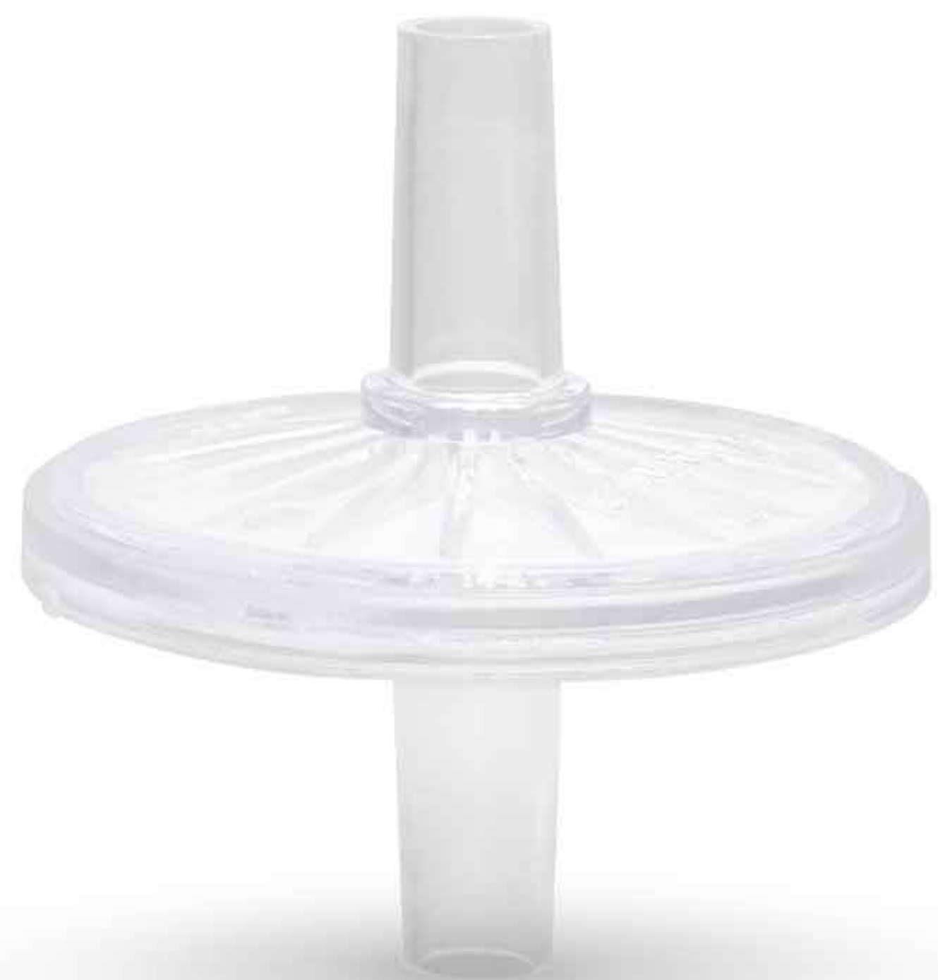
Bacterial Filter فیلتر باکتری