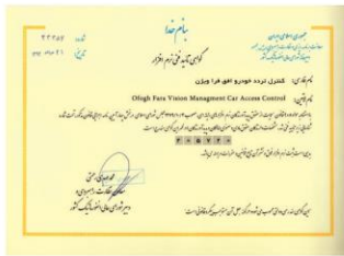
مدیریت کنترل تردد خودرو شماره ثبت : ۲۷۵۷۲۰

عضویت در شورای عالی انفورماتیک کشور عضو اتاق بازرگانی جمهوری اسلامی ایران گواهی تائید فنی نرم افزاری