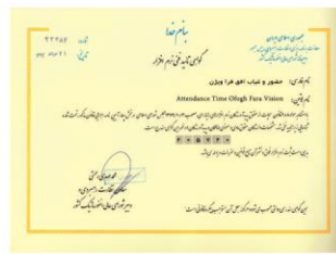
حضور و غیاب افق شماره ثبت : ۲۰۴۸۱۹