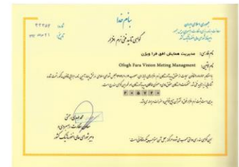
مدیریت همایش افق شماره ثبت : ۲۰۵۷۲۸