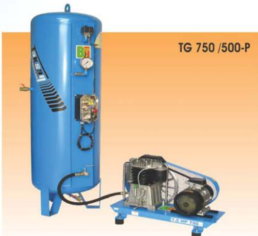
TG 750 / 500-P