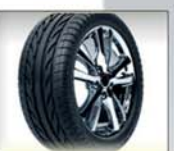
لاستیک و پلاستیک