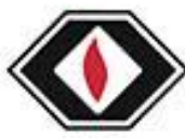
دیر گذاز آذر