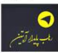
رهاب پایدار آبتین