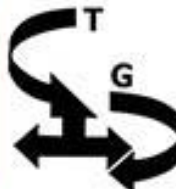
رهاب پایدار آبتین