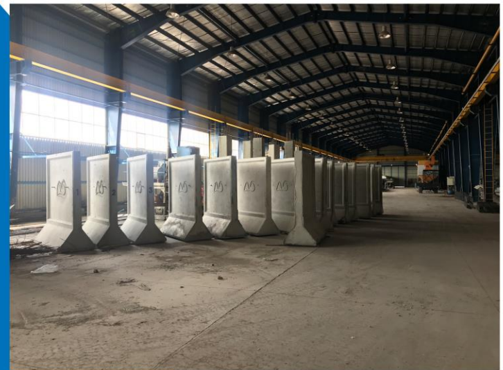
دیوار خود ایستا دارای پاشنه