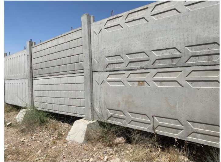
دیوار پنلی : دارای گلدانی - ستون - پنل